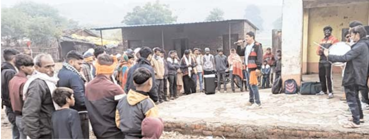
पशुधन बीमा, ऋण और पुनर्भुगतान, के माध्यम से बैंकिंग, ग्राहक सुरक्षा और शिक्षा के बारे में जन जागरूकता पैदा की गई। बाजना ब्लॉक के ग्रामीण इलाकों सेमलिया, संदला, खंदन और

बैंक में व्यवहार के बारे में वित्तीय नियोजन कैसे करें, इसकी सभी जानकारी नुकड़ नाटक से वित्तीय नियोजन और बजटिंग, बचत और निवेश, बीमा, प्रधानमंत्री जीवन ज्योति बीमा, प्रधानमंत्री सुरक्षा बीमा योजना, फसल बीमा और